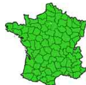
■ Zone de culture