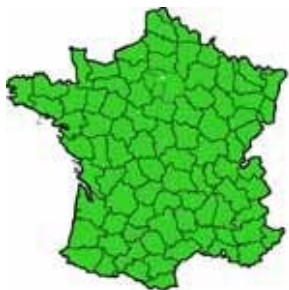
Zone du culture